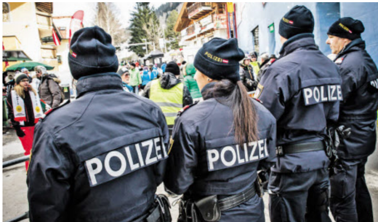
Überraschend ruhig verlief die WM bisher für die Polizei.

So gesehen erklärt der derzeitige Medaillenspiegel, warum die Polizei bislang unterbeschäftigt war.